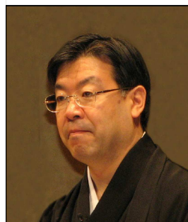
京都府山田知事 (写真中央)